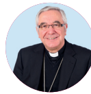
† Manuel Sánchez Monge Obispo de Santander

en generosidad y nos devuelve mucho más de lo que damos. “El que siembra tacañamente, tacañamente cosechará; el que siembra generosamente, generosamente cosechará” (2 Cor 9, 6).